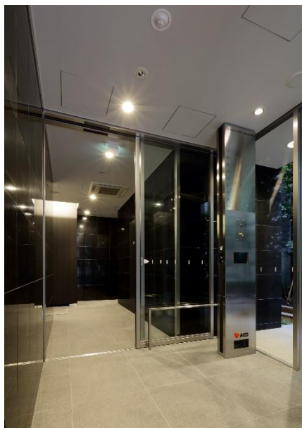
<風除室・エントランスホール>