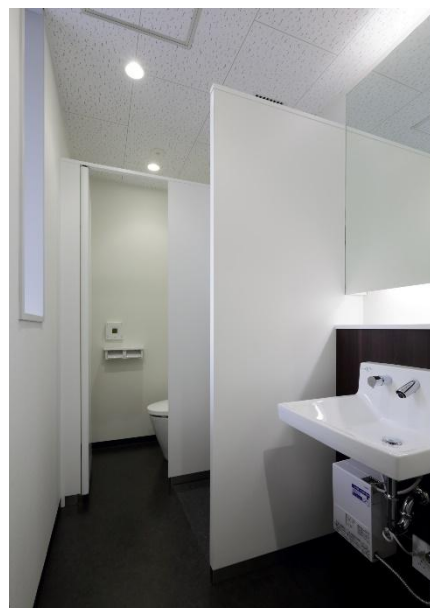
<男性用トイレ（基準階）>