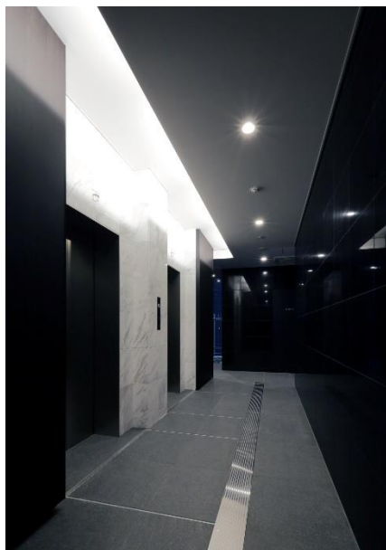
<エレベーターホール（1階）>