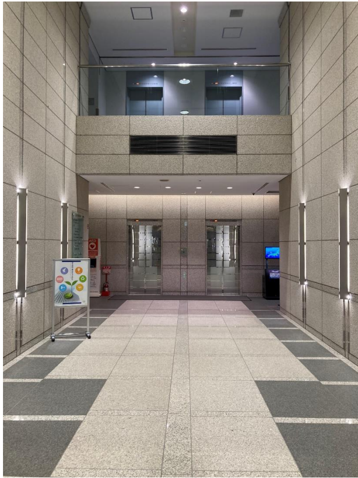
1階 エントランスホール