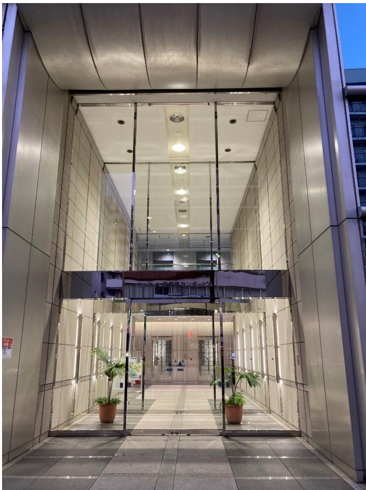
1階 エントランス(夜間ライトアップ)