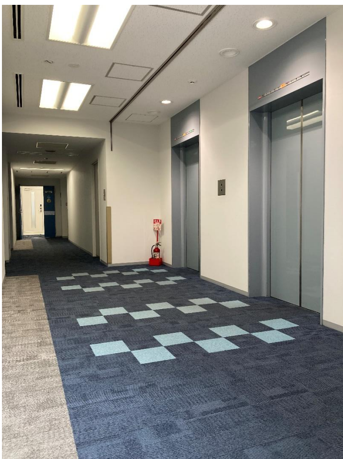
6階 エレベーターホール