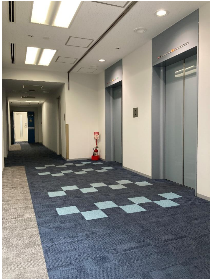
6階 エレベーターホール